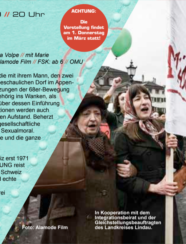
In Kooperation mit dem Integrationsbeirat und der Gleichstellungsbeauftragten des Landkreises Lindau.

Beim Tribeca Film Festival in New York gewann der Film den Zuschauerpreis und den Nora-Ephron-Preis. Hauptdarstellerin Marie Leuenberger wurde als beste Schauspielerin in einem internationalen Film geehrt.